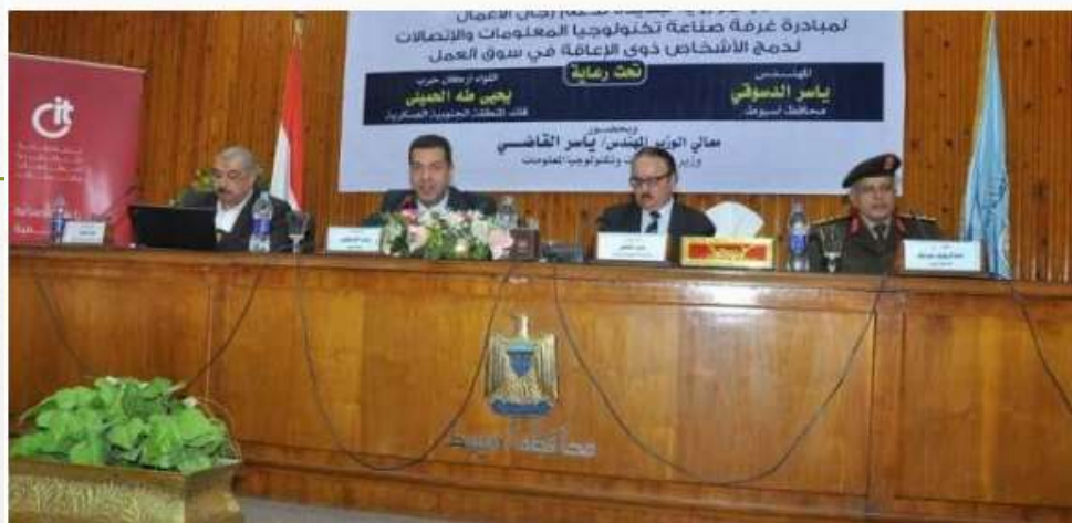
المهندس ياسر القاضى وزير الاتصالات ارضيفية