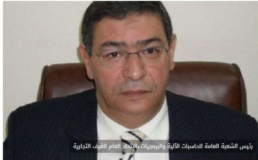
رئيس الشعبة العامة للحاسبات الآلية والبرمجيات بالاتحاد العام للغرف التجارية